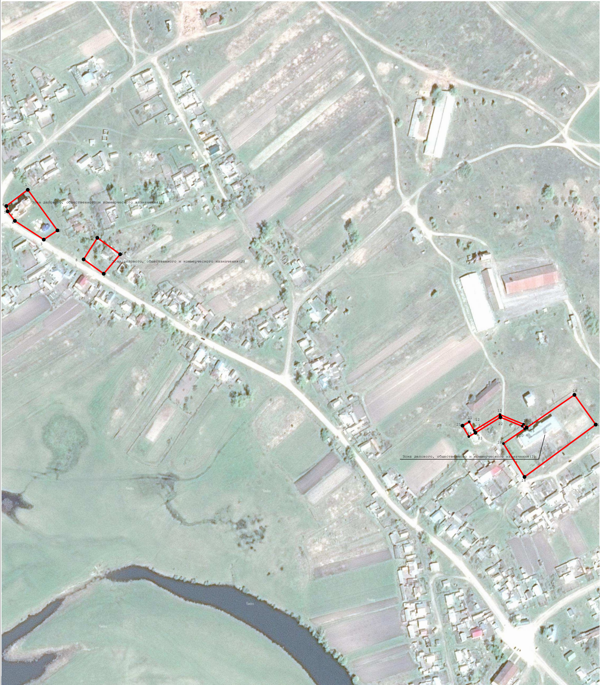
Масштаб 1:3 000